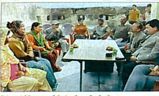
नैनीताल में विधिक सहायता केंद्र में उपस्थित उत्पीड़ित किन्नरों।