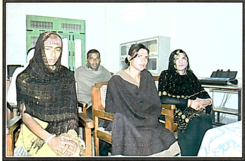
DLSA Bageshwar apprising the Transgender Community about their legal rights.

किन्नरों को न्याय प्रदान करने के लिए विधिक सहायता केंद्र के अधिकारी किन्नरों को उनके अधिकारों के बारे में जानकारी दे रहे हैं।