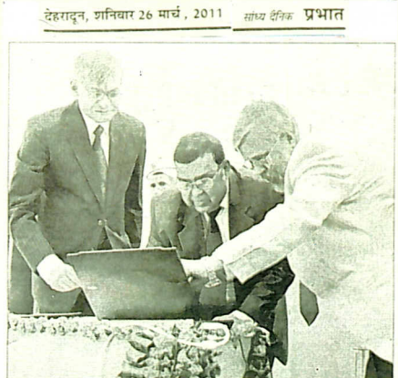
महा सो.क. अदालत में वेबसाइट का उद्घाटन करने व्यापारिका अलमस कबीर व अन्य।

In order to reach the common masses via the electronic media, the website of the Uttarakhand State Legal Services Authority i.e. www.slsa.uk.gov.in was launched by Hon'ble Mr. Justice Altamas Kabir, Judge Supreme Court of India & Executive Chairman, National Legal Services Authority on 25 th March, 2011 on the occasion of Mega Lok Adalat at Dehradun. This site contains the history of Uttarakhand SLSA, its activities with photographs, 34 valuable legal books namely "SaraI Kannuni Gyan Mala" which can be easily downloaded, achievements of Uttarakhand SLSA and all information regarding accessibility to free legal services have been uploaded on the site. A common man can easily log-on to the aforesaid web-address and get the necessary information about beneficial schemes of the Uttarakhand State Legal Services Authority.