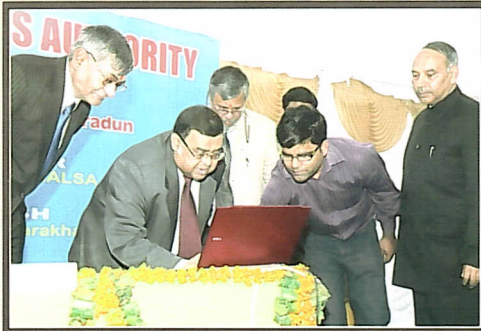
Hon'ble Mr. Justice Altamas Kabir, Judge, Supreme Court of India & Executive Chairman, NALSA launching the Uttarakhand SLSA's website on 25 th March, 2011 at Dehradun.