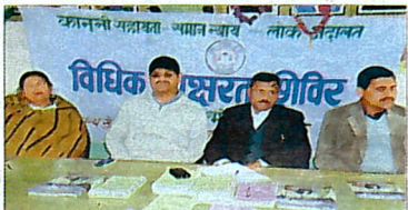
अल्मोड़ा के नगरपालिका सभागार में विधिक किन्नर दिवस पर मुख्य न्यायिक मजिस्ट्रेट जामराज।

जागरण कार्यक्रम, अल्मोड़ा जिला विधिक सेवा प्राधिकरण द्वारा विधिक किन्नर दिवस का आयोजन किया गया। नगरपालिका सभागार में आयोजित गोष्ठी में किन्नर समुदाय के लोगों से चर्चा प्रारंभ की गई।