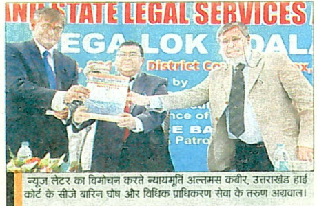
न्यून लैटर का विमोचन करते न्यायमूर्ति अलतमस कबीर, उत्तराखंड हाई कोर्ट के सीजे बारिन घोष और विधिक प्राधिकरण सेवा के तरुण अग्रवाल।

इस अवसर पर मुख्य न्यायाधीश उत्तराखंड न्यायमूर्ति बारिन घोष ने कहा कि हाईकोर्ट में लंबित 37 हजार मामलों में से अब तक 20 हजार वादों का निस्तारण हुआ है। उन्होंने कहा कि लोक अदालत के जरिए न्यायपालिका दूर-दराज के इलाकों में पहुंच रही है।