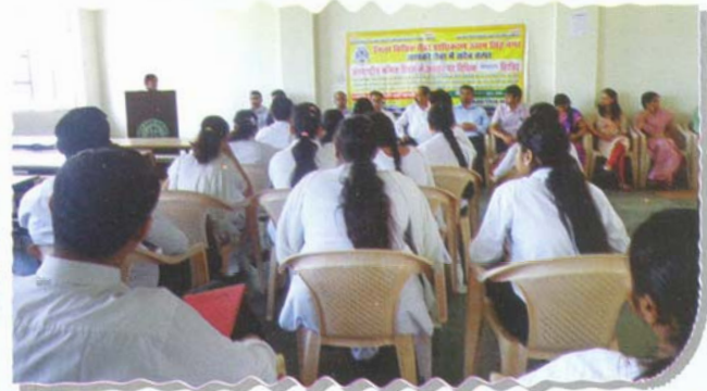
Law student on International Labour Day at Unity Law College, Rudrapur