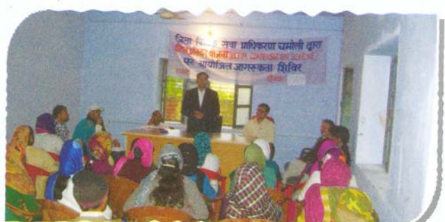
Awareness camp for victims of natural disaster at Tehsil compound Tharali