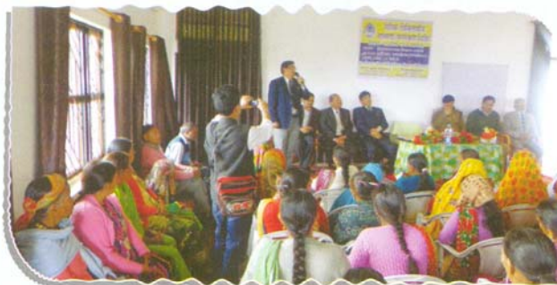
Awareness camp on 12.4.15 at Dashailthal District Pithoragarh DJ

48 micro/mega/special legal awareness camps on subjects such , Right to Information, Police Act, Labour Law, M.A.C.T., Dowry Prohibition Act, Copying Act, Indian Education Act, Child Labour, Revenue Laws, Domestic Violence Act, Female Foeticide Act, Forest Laws and MNREGS were organized in different parts of the State wherein 6015 persons from various strata of society participated and got benefitted.