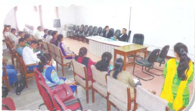
Chairperson, DLSA, Pithoragarh interacting with PLVs