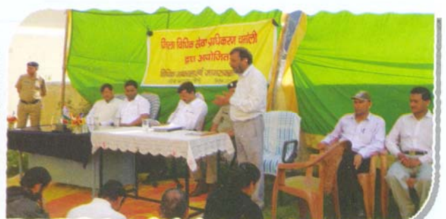
22.4.15 Sensitization camp at District Jail-Chamoli on prisoner's rights

48 micro/mega/special legal awareness camps on subjects such , Right to Information, Police Act, Labour Law, M.A.C.T., Dowry Prohibition Act, Copying Act, Indian Education Act, Child Labour, Revenue Laws, Domestic Violence Act, Female Foeticide Act, Forest Laws and MNREGS were organized in different parts of the State wherein 6015 persons from various strata of society participated and got benefitted.