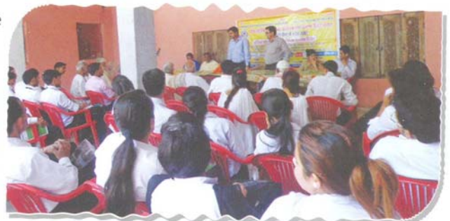
Awareness camp on fundamental duties and rights at Ramnagar Bhamrola, Rudrapur

At school level, 16 legal awareness camps were organized on the subject of 'Fundamental Duties' wherein 3316 students were sensitized about their fundamental rights and duties. Students were also informed about relevant provisions of law, such as Right to Information, Right to Education and Child Marriage.