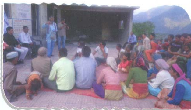
Para Legal Volunteer making awareness among the people

During this period, State Legal Services Authority's mobile van covered 57 villages of the aforesaid districts and 2809 persons were benefited. One Mobile Lok Adalat was also conducted in District-Pauri Garhwal, wherein 43 cases were referred, 13 cases were settled amicably and 50 persons were benefited.