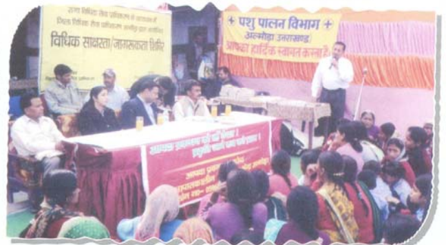
Special camp for disaster victims on 16.4.2015 at Almora

Apart from above, 06 camps were also conducted for providing necessary legal aid and compensation to the victims of natural calamity, wherein 2230 persons were benefited by getting information about the schemes run by State Government for their welfare.