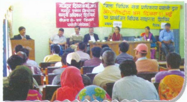
Awareness camp on International Labour Day at Gopeshwar, District-Chamoli

On the occasion of 'International Labour Day' on 1.5.2015, total 11 legal awareness camps and 03 seminars were conducted at different places of Uttarakhand. The aim of these awareness camps was to protect the legal rights of the workers serving in unorganized sector. In these camps, 1441 workers were sensitized.