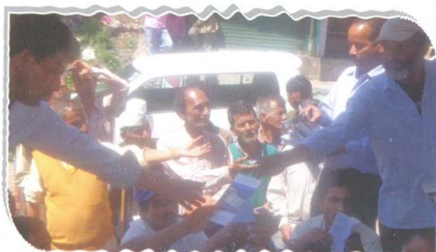
Distribution of legal informative booklets

To provide legal aid and advice at the doorsteps, legal awareness and sensitization camps were organized through mobile van in districts Dehradun, Uttarkashi and Pauri Garhwal during the period from April, 2015 to June, 2015. In the said camps, documentary films on the subjects of mediation, lok adalat and legal aid prepared by National Legal Services Authority and State Legal Services Authority were displayed to the common people. The queries raised by the villagers were also solved in these camps.