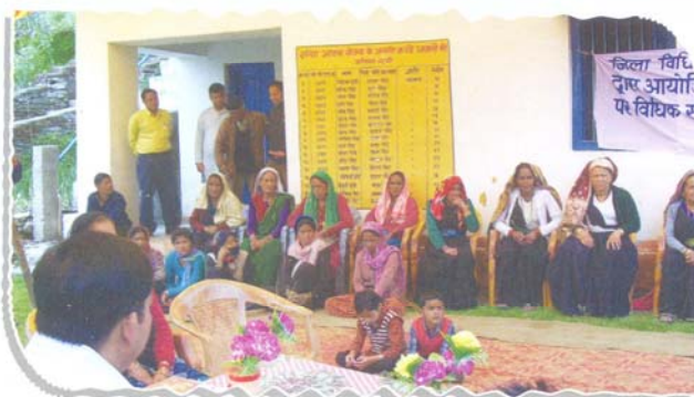
Awareness camp at Tharali, District-Chamoli for rehabilitation for disaster victims