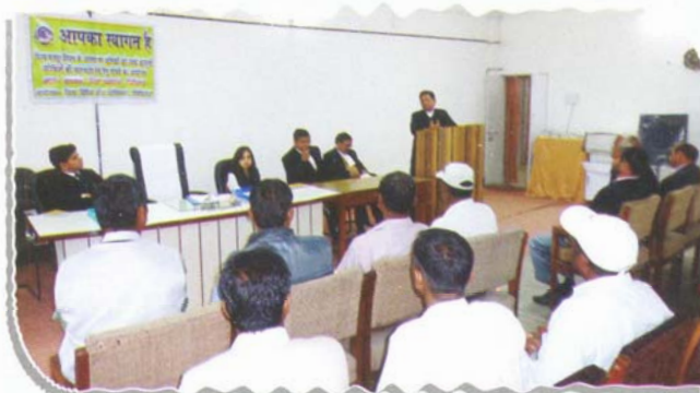
Seminar on International Labour Day at Pithoragarh