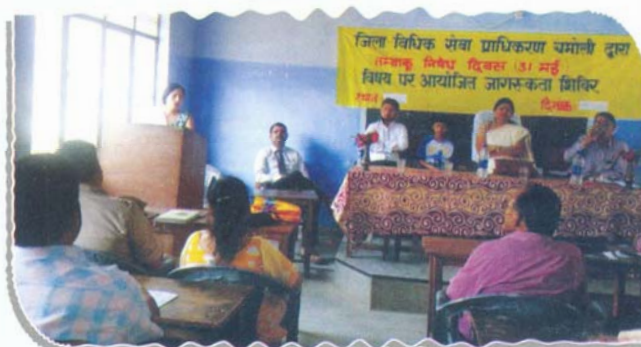
Camp on NoTobacco Day at GIC Langasu, District-Chamoli

'World No Tobacco Day' was celebrated on 31.5.2015 by conducting 11 legal awareness and sensitization camps, wherein 937 people were sensitized about the ill effects caused by the intake of tobacco products. They were also urged to quit the use of these substances.