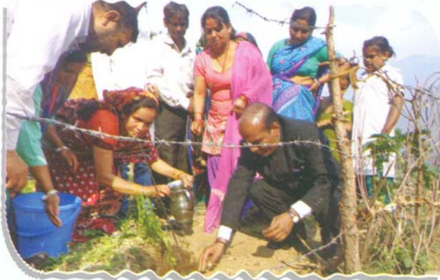
Plantation on World Environment Day at Brahmsain, District-Chamoli

'World Environment Day' was observed on 5.6.2015 and on the said occasion 16 legal awareness camps were organized. In these camps, 2824 people were made aware about the excessive emission of green house gases and their adverse effects on earth, like pollution and global warming. An appeal was also made to protect our environment.