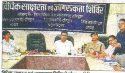
विधिक साक्षरता एवं जागरूकता शिविर में मौजूद अतिथि।