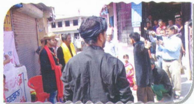
Street Play on No Tobacco Day at Pauri Garhwal