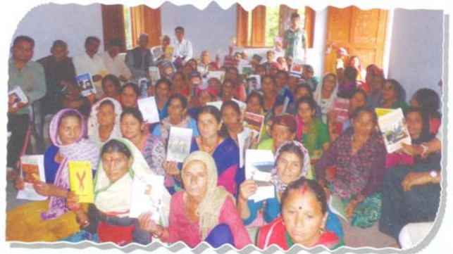
Gathering in sensitization camp on 31.6.2015 at Uttarkashi

At school level, 16 legal awareness camps were organized on the subject of 'Fundamental Duties' wherein 3316 students were sensitized about their fundamental rights and duties. Students were also informed about relevant provisions of law, such as Right to Information, Right to Education and Child Marriage.