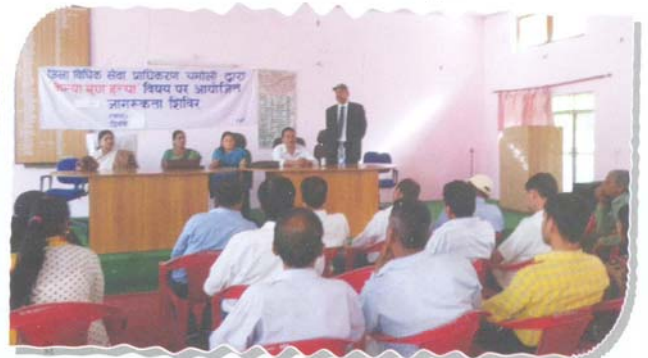
Camp on women empowerment and female foeticide at Karnaprayag, District-Chamoli

Apart from above, 06 camps were also conducted for providing necessary legal aid and compensation to the victims of natural calamity, wherein 2230 persons were benefited by getting information about the schemes run by State Government for their welfare.