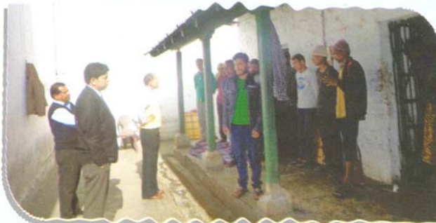
Visit of Judicial Lockup by Secretary DLSA Pithoragarh

With view to provide necessary legal aid to the under-trial prisoners, 26 camps were organized in jail premises wherein 2609 prisoners were made aware about their legal rights and the legal aid available to them.