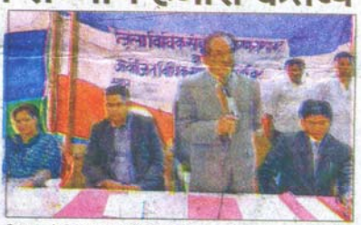
भिगराड़ा में विधिक शिविर में बोलते जिला जज।