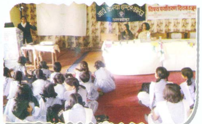
Secretary, DLSA, Almora sensitizing the students on World Environment Day