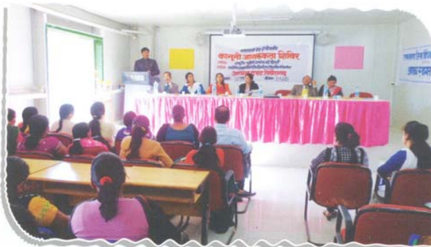
Special camp on women empowerment and female foeticide at SIT Institute, District-Pithoragarh

In order to sensitize the female community about their legal rights and the issues relating to them, 16 legal awareness camps were organized benefiting 2317 females.