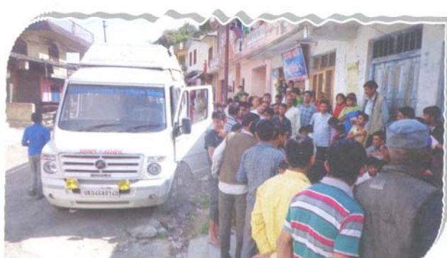
Gathering during the mobile van visit

During this period, State Legal Services Authority's mobile van covered 57 villages of the aforesaid districts and 2809 persons were benefited. One Mobile Lok Adalat was also conducted in District-Pauri Garhwal, wherein 43 cases were referred, 13 cases were settled amicably and 50 persons were benefited.