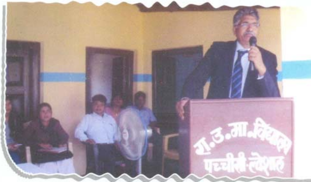
Chairman, DLSA, Almora sensitization the senior citizens about their legal rights