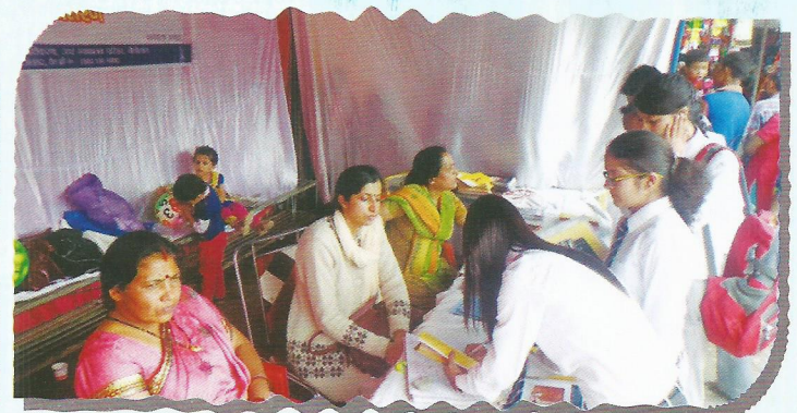
Officer on Special Duty, Uttarakhand SLSA at the Harela Mela stall

On the occasion of Nandastami Mela, the Uttarakhand State Legal Services Authority in coordination with District Legal Services Authority installed a stall at Flat Ground, Nainital from 07.09.2016 to 11.09.2016. People visiting the stall were informed about the importance of common laws relating to their day-to-day life and their legal rights. A total number of 2965 persons were benefited and 5,965 books on various subjects of law were distributed.