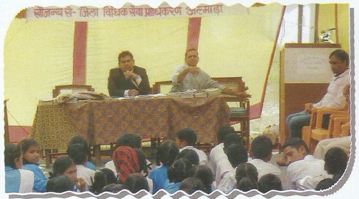
On 14.9.2016 Secretary, DLSA, Almora telling about Child Rights