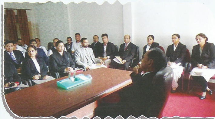
Sensitization programme on Mediation held on 26-08-2016 by DLSA US Nagar