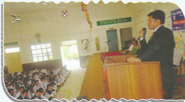
Secretary DLSA Pauri Garhwal informing the students about their child rights