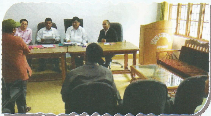
Chairperson, DLSA Uttarkashi during the sensitization programme