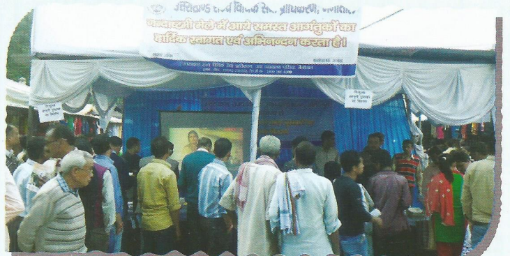
Gathering during the Nandastami Fair at Nainital