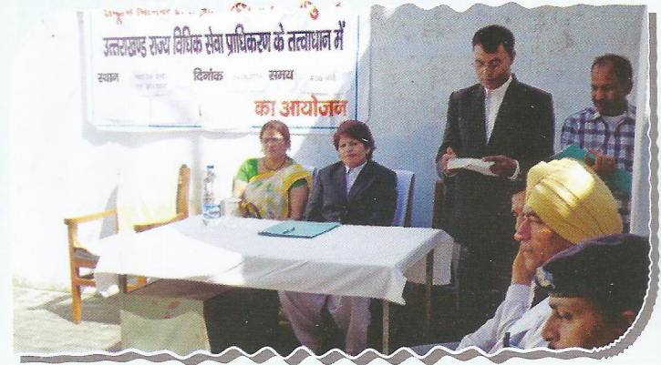
Secretary, DLSA, Champawat during the camp at judicial lockup