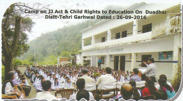
Awareness camp on JJ Act and Child Rights at Tehri Garhwal