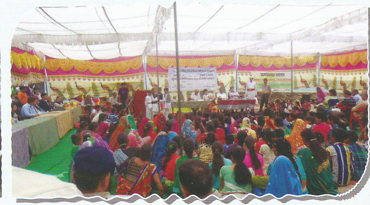
Chairperson, DLSA, Nainital during the multipurpose Camp at Basgaown on 18-09-2016