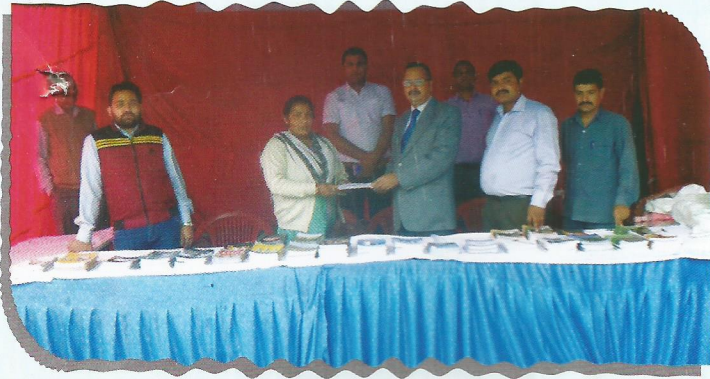
Member Secretary, Uttarakhand SLSA distributing legal informative booklets at Harela Fair