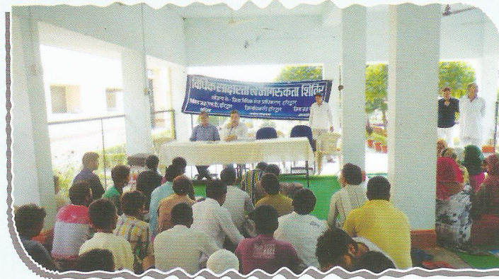
Secretary, DLSA, Haridwar sensitizing the under-trial prisoners