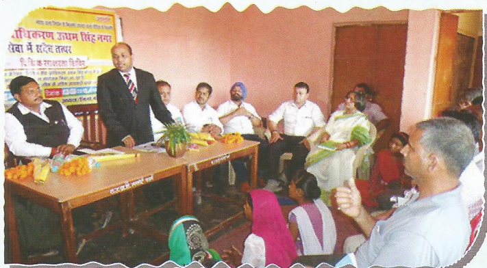
Legal Aid and Awareness Camp in Primary School Escort Farm, Kashipur on 26-07-2016 By DLSA U.S. Nagar