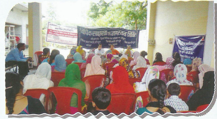
Secretary, DLSA, Haridwar sensitizing the gathering about women rights