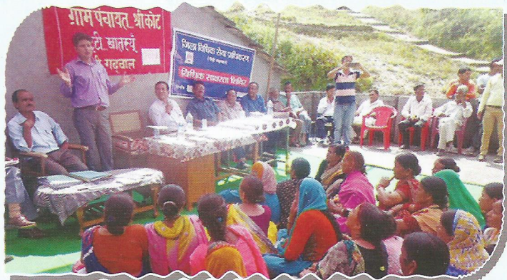
Legal awareness camp on children rights in District-Pauri