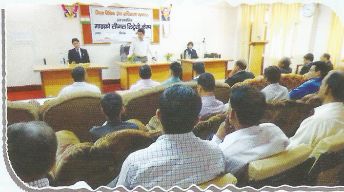
Chairperson, DLSA, Champawat addressing the gathering on Hindi Day