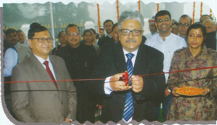
Hon'ble the Patron-in-Chief, Uttarakhand SLSA inaugurating the building of ADR Centre at High Court premises

On 23.7.2016, the ADR Building at High Court premises, Nainital was inaugurated by the Hon'ble Patron-in-Chief, Uttarakhand SLSA in the benign presence of Hon'ble Executive Chairman, UKSLSA and other Hon'ble Judges of the High Court. During the said occasion, the Member Secretary and Officer on Special Duty, UKSLSA, Registrars of the High Court and Advocates were also present. Now, the office of Uttarakhand State Legal Services Authority is functional at the said building.