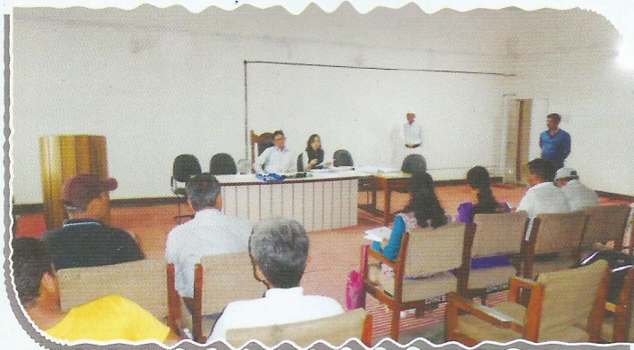
Chairman and Secretary, DLSA, Pithoragarh in the PLV Meeting on 31-08-2016