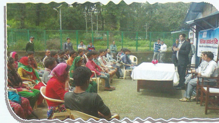
Legal Awareness Camp for Unorganised Labours at Ntl on 20-8-2016