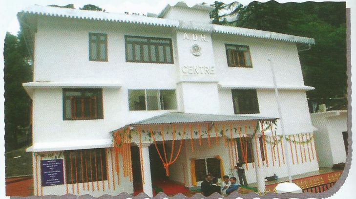
Building of ADR Centre at High Court premises, Nainital