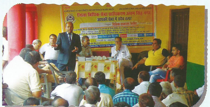
Camp on World Population Day in Govt. hospital, Rudrapur by DLSA US Nagar

Also, the people at large were made aware about the seven schemes launched by National Legal Services Authority, by all the District Legal Services Authorities by organizing legal awareness camps, programmes and seminars.