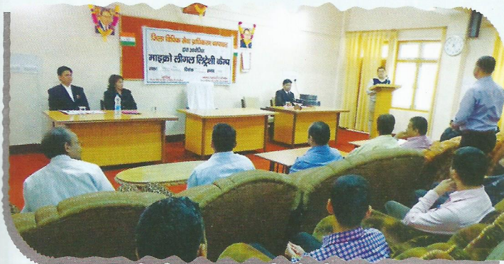
Camp on World Hepatitis Day at Champawat

Between the months of July, 2016 to September, 2016, the World Population Day, World Hepatitis Day and International Literacy Day were observed throughout the State. During these occasions, 38 special legal literacy and awareness camps were organized wherein 2300 people got benefited.