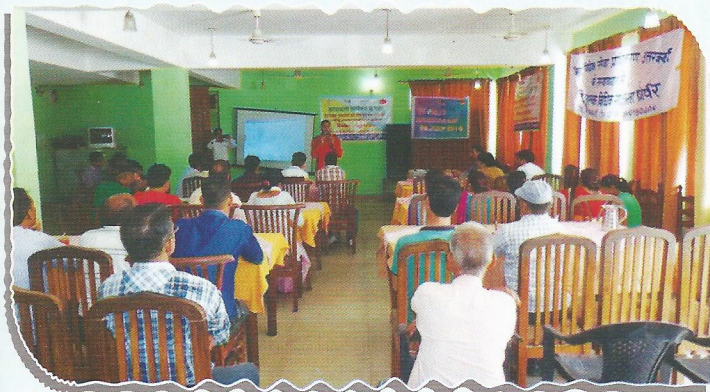
Awareness camp on World Hepatitis Day at Uttarkashi