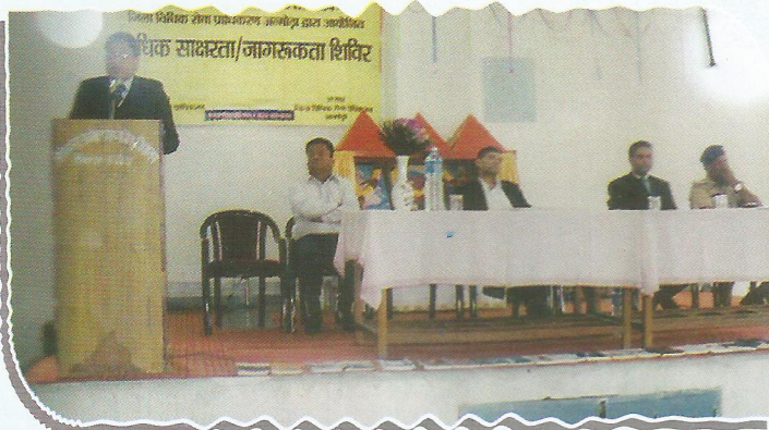
On 28.8.2016 Chairperson, DLSA, Almora informing the labourers about their legal rights