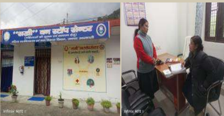
Workshop was organized by the DLSA Uttarkashi on 14.03.2023 for Advocates.