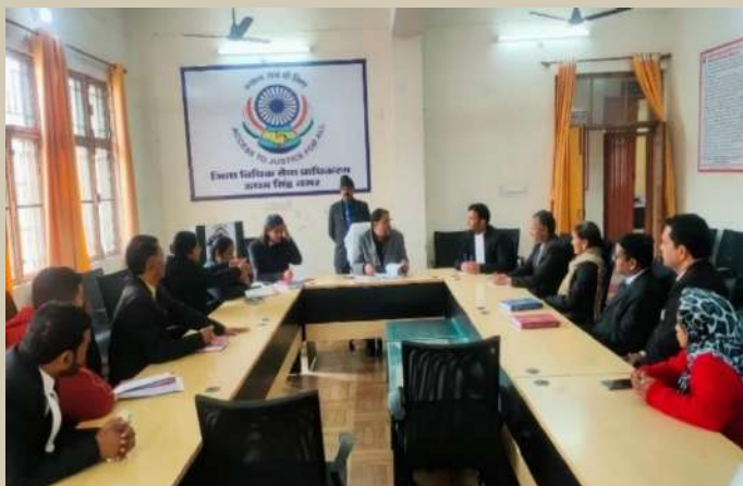
Meeting with Panel Lawyers on 04.02.2023 at ADR Center, Rudrapur, by the DLSA U.S. Nagar.