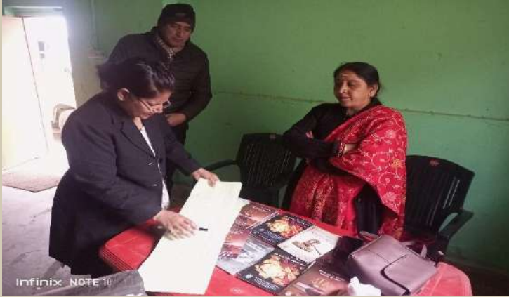
Workers' Facilitation Center at Joshiyada was visited by the Secretary, DLSA, Uttarkashi on 10.02.2023.