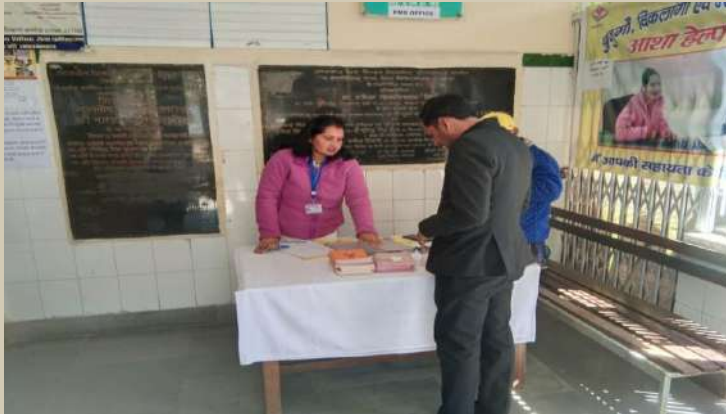
To review the working of Front Office, the Secretary, DLSA Almora visited the same on 09.02.2023.

Visit and skill development programme was conducted in Nari Niketan, Almora by the Secretary, DLSA Almora on 25.02.2023.