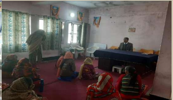
Visit of Legal Aid Clinic, Tehsil Ranikhet was organized on 14.02.2023.