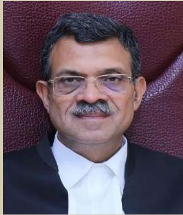
Hon'ble Mr. Justice Vipin Sanghi Hon'ble Patron-in-Chief, UKLSA, Nainital