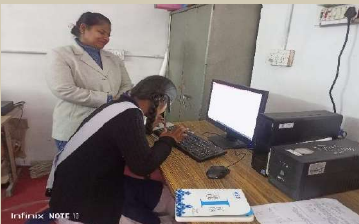
Front Office was visited by the Secretary, DLSA Uttarkashi on 08.02.2023.