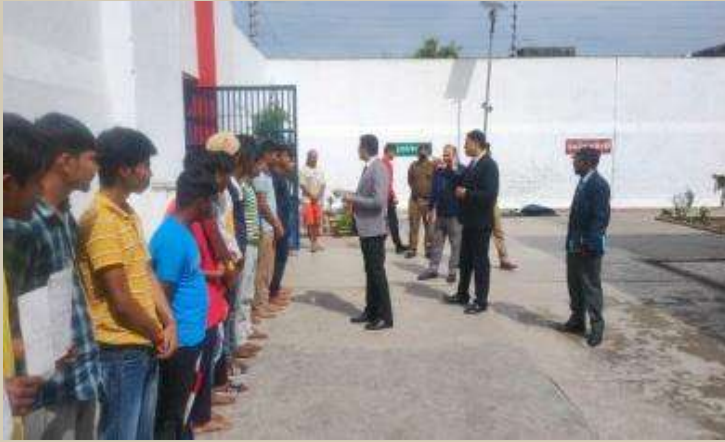
Observation Home Haldwani was visited by the Secretary, DLSA, U.S. Nagar on 22.02.2023.