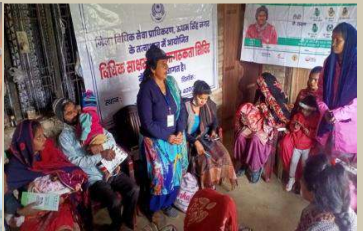
DLSA U.S. Nagar conducted a meeting with PLVs on 03.02.2023 at ADR Center, Rudrapur.