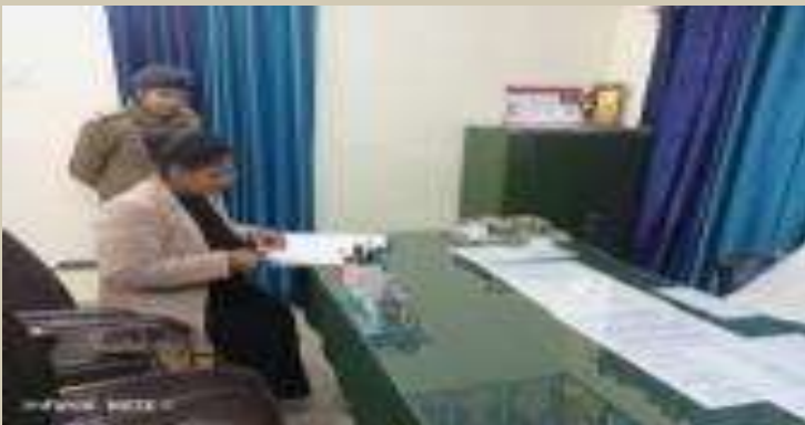
Secretary, DLSA Uttarkashi visited Legal Aid Clinic at Worker's Facilitation Center on 10.02.2023.